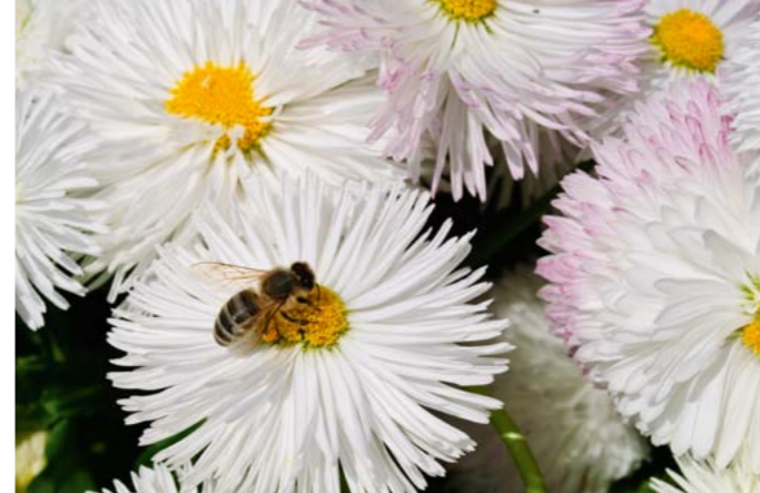
Tausendschön | Bellis perennis