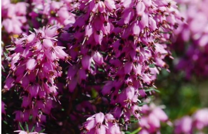
Schneeheide | Erica carnea