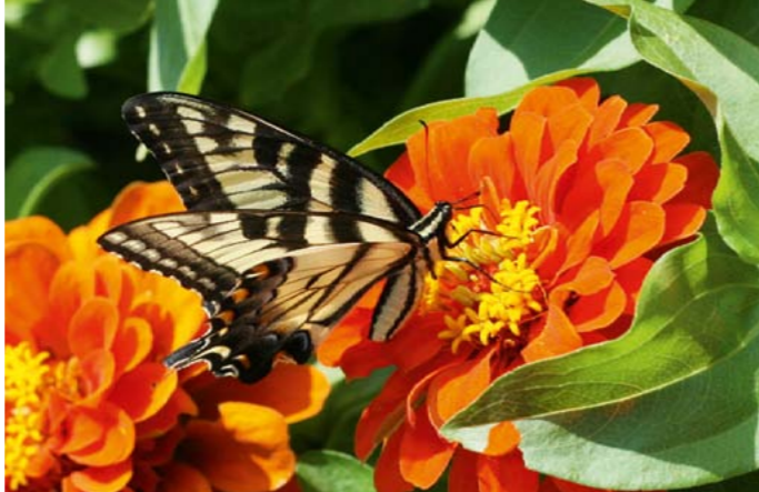
Zinnie | Zinnia sp.