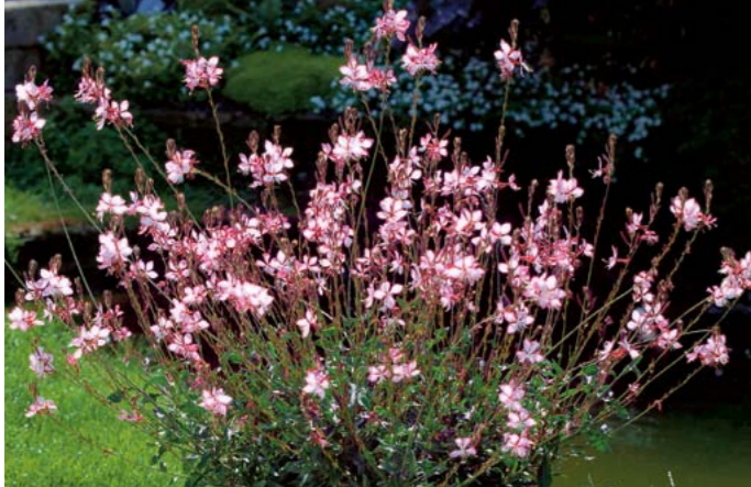
Prachtkerze | Gaura lindheimeri