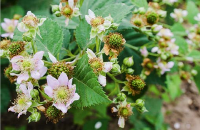
Brombeere | Rubus fruticosus