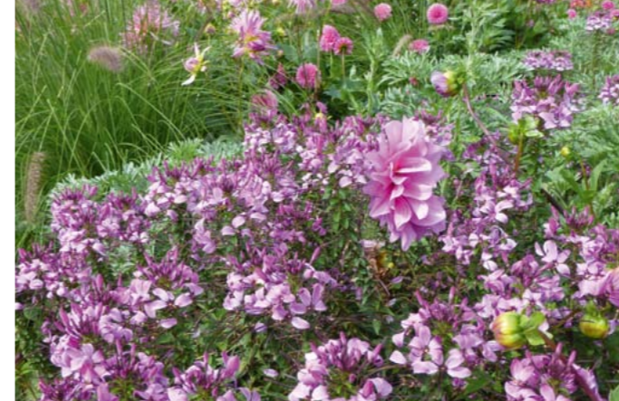
Spinnenblume | Cleome spinosa