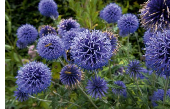
Kugeldistel | Echinops ritro