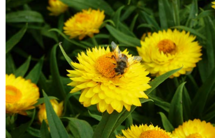
Strohblume | Helichrysum bracteatum