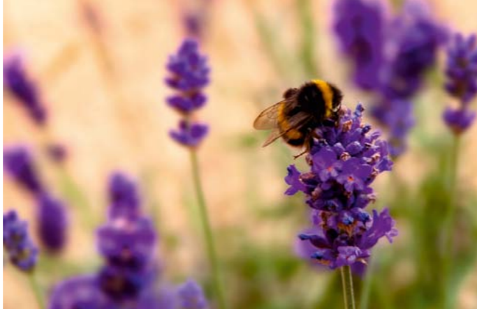
Echter Lavendel | Lavendula sp.