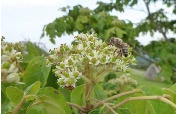
Bienenbaum | Tetradium daniellii