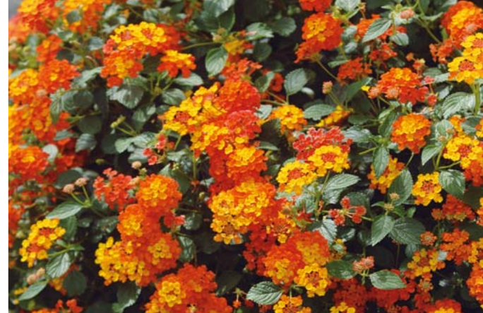
Wandelröschen | Lantana camara