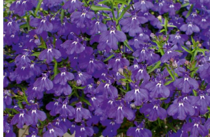
Männertreu | Lobelia erinus