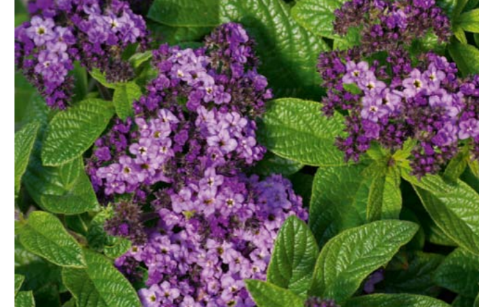
Garten-Vanilleblume | Heliotropium arborescens