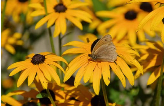
Sonnenhut | Rudbeckia sp.