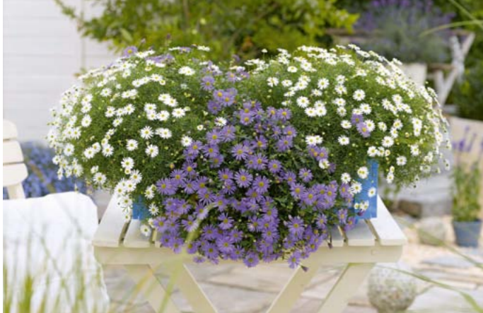
Blaues Gänseblümchen | Brachyscome iberidifolia