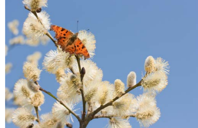
Salweide, Palmweide | Salix caprea