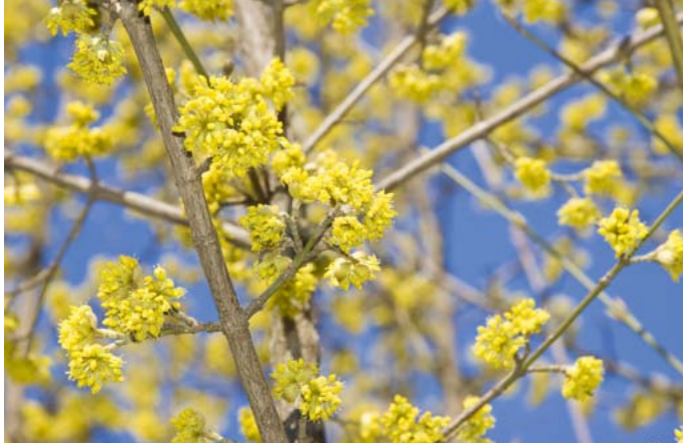
Kornelkirsche | Cornus mas