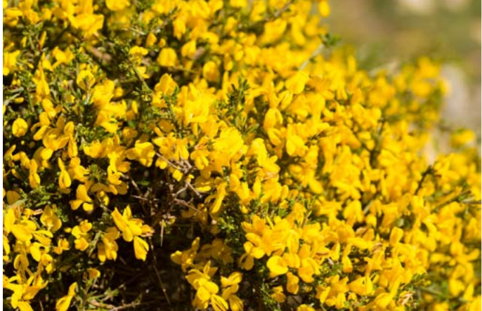
Ginster | Genista sp.