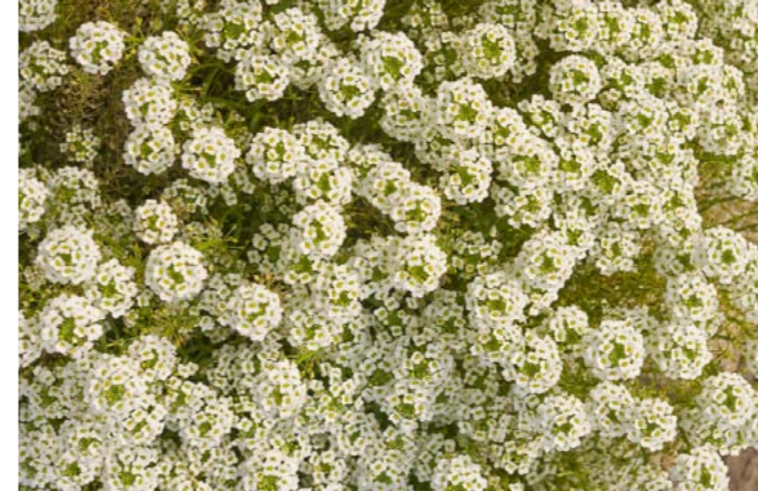
Duftsteinrich | Lobularia maritima