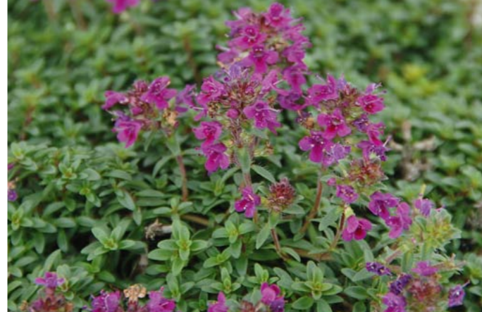
Thymian | Thymus sp.